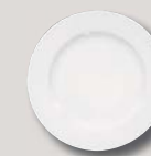
Teller flach 20 cm Plate flat with rim